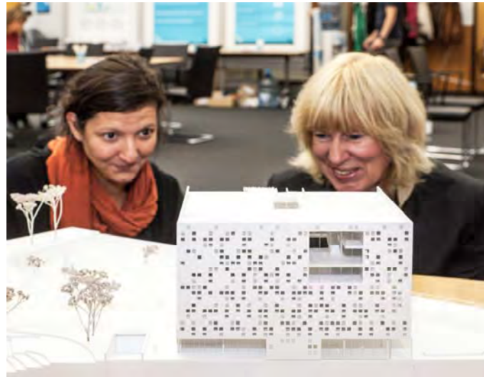
Modell M 1:200 des überarbeiteten Entwurf von prosa architekten, Darmstadt, und Rehwaldt Landschaftsarchitekten, Dresden