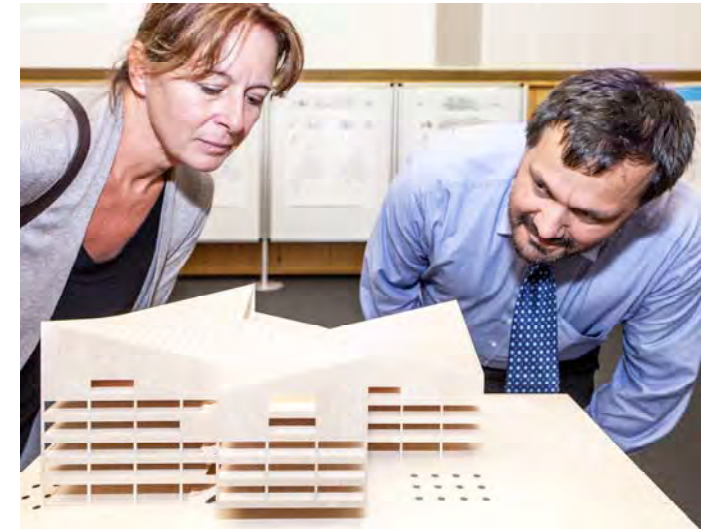
Modell M 1:200 des überarbeiteten Entwurf von Esa Ruskeepää Architects Ltd, Helsinki, und Fugmann Janotta Landscape Architecture and Landscape Development BDLA, Berlin