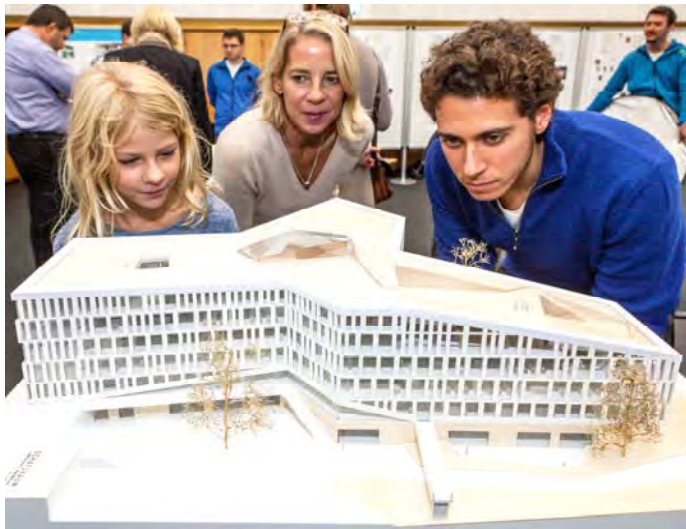
Modell M 1:200 des überarbeiteten Entwurf von Schaltraum Architektur, Hamburg, mit Werner Sobek Stuttgart GmbH, Stuttgart, und HinnenthalSchaar Landschaftsarchitekten, München